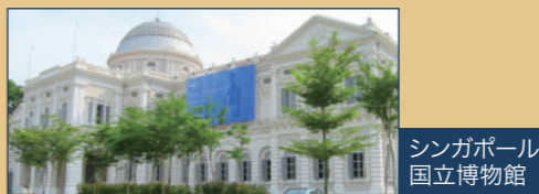
シンガポール国立博物館

【シンガポール滞在時のご宿泊ホテル】 A-1・A-3 コース<スーパーリアクラス>コンコルドホテル A-2・A-4・B・C・D・E・F コース<デラックスクラス> JW マリオットホテルまたはグランドパークシティホール