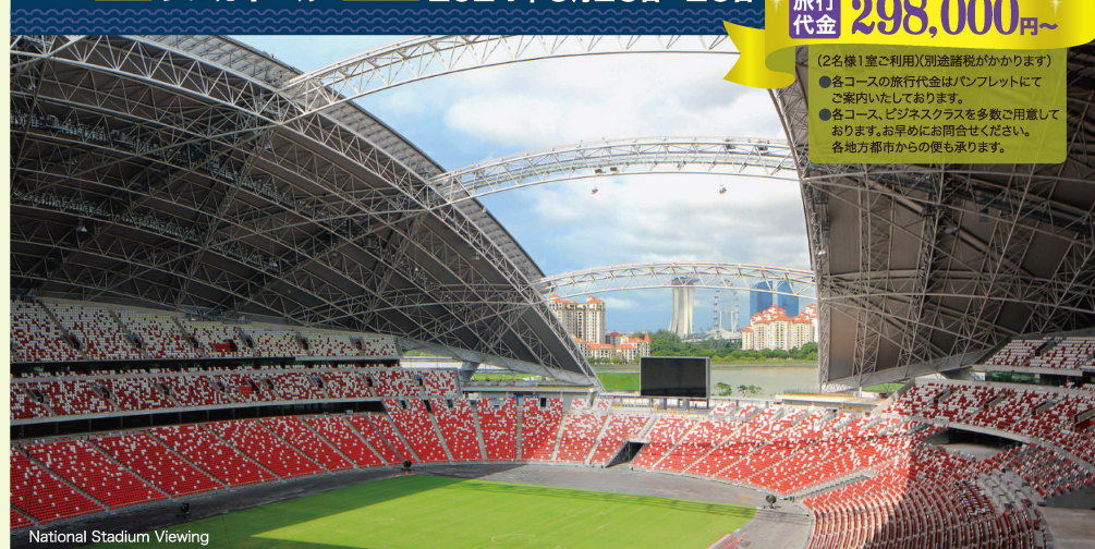
National Stadium Viewing

(2名様1室ご利用)(別途諸税がかかります) ● 各コースの旅行代金はパンフレットにてご案内いたしております。 ● 各コース、ビジネスクラスを多数ご利用意しております。お早めにお問合せください。 各地方都市からの便も承ります。