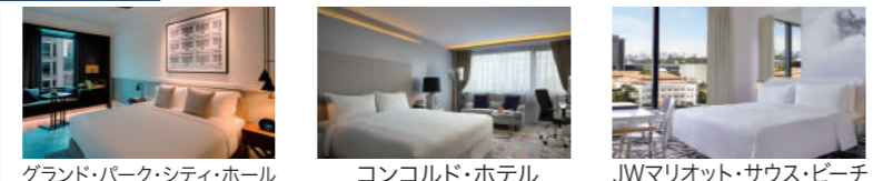
グランド・パーク・シティ・ホール コンコルド・ホテル JWマリオット・サウス・ビーチ